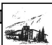
Heilig Geist Oberjoch