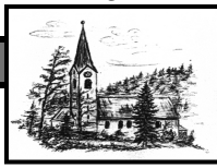
Heiligste Dreifaltigkeit Unterjoch