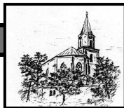
St. Johannes Bad Hindelang

der katholischen Pfarreiengemeinschaft Bad Hindelang